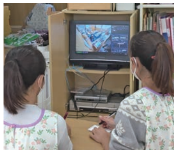
スタッフで見直しなどに活用