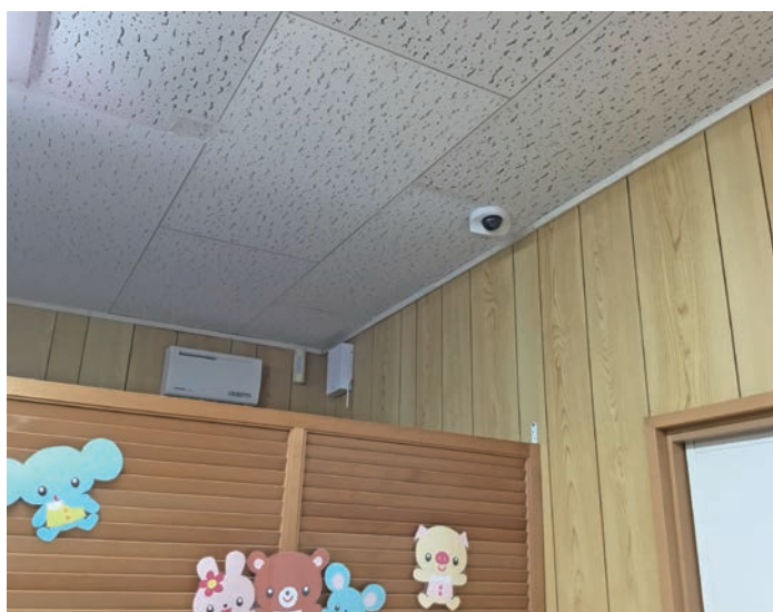
部屋ごとにカメラを設置