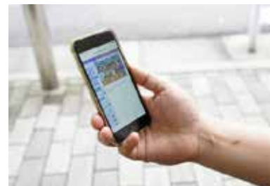
保護者は映像をスマートフォンで見ることが多い(写真はイメージです)

お預かりするときにお子さんが泣いてしまうこともあるじゃないですか。そういうときは気になってご覧になるんですね。カメラで子どもが元気に遊んでいる様子を見て、安心されることが多いようです。