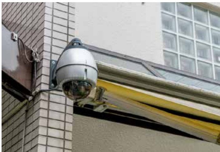
園庭の BB-HCM581 。外に向けて BB-HCM735 も設置